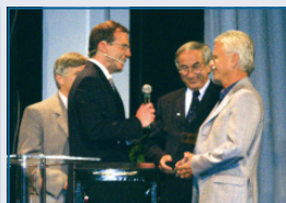
Preisverleihung „Fast Forward Award 2004“