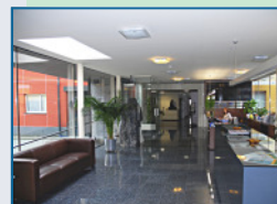
IPUS Firmengebäude in Rottenmann (Steiermark)