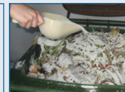
Anwendung von IPUS gastro